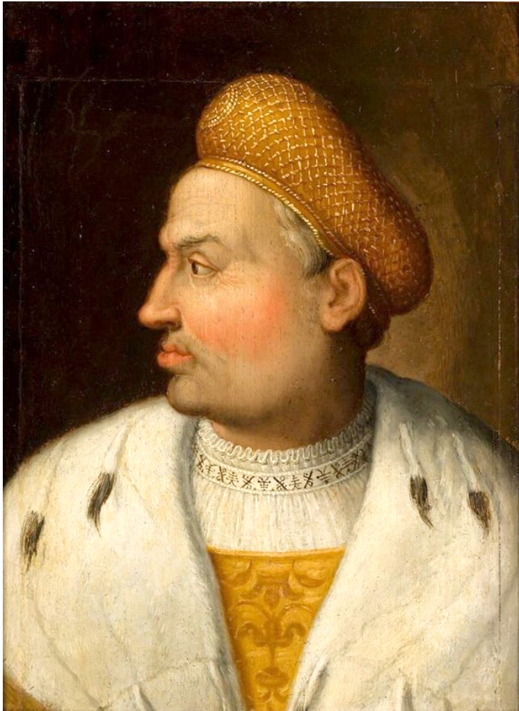
Іл. 1. Ганс фон Кульмбах. Портрет Сигізмунда I.