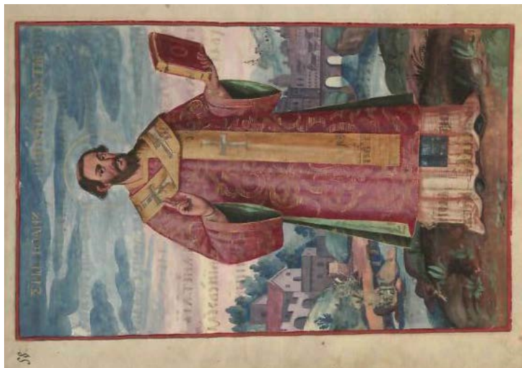
Іл. 2. Ілюстрація зі Служебника архієрейського 1632 р. Джерело: Служебник і Трєбник Петра Мозими. 1632 р. ІР НБУВ. Ф. 312, (прим. № 60). URL: http://irbis-nbuv.gov.ua/dlib/item/00000029 (дата звернення: 18.03.2021)