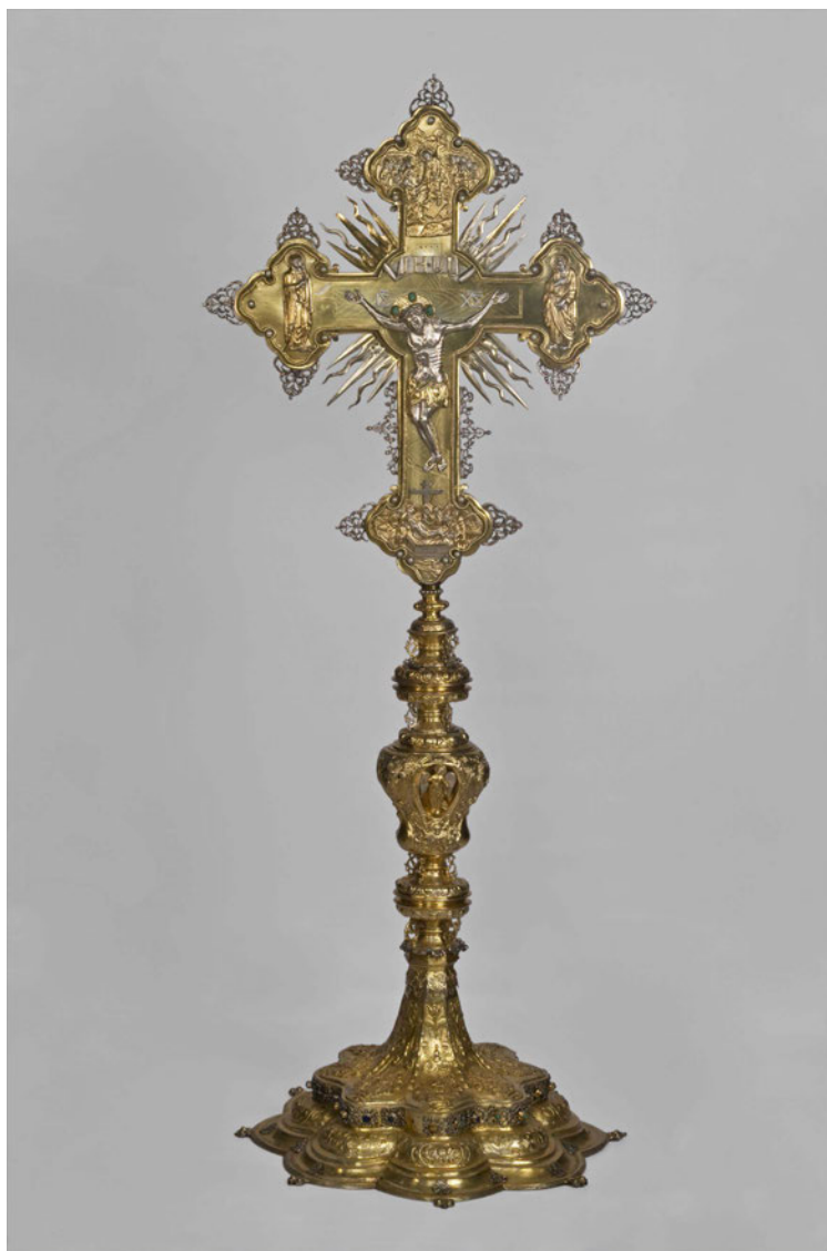
Іл.1. Напрестольний хрест із гербом митрополита Петра Могили.