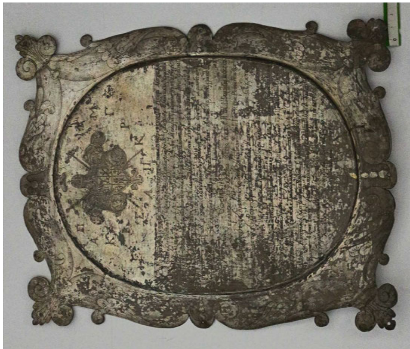
Іл. 3. Пластина-епітафія до реставрації. Загальний вигляд.