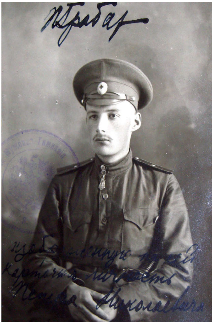
Іл. 5. Петро Грaбaр. 1916 р.