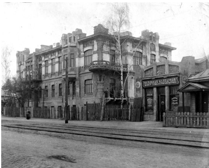
Іл. 2. Будинок та службовий флігель Грабарів. 1910-і рр.