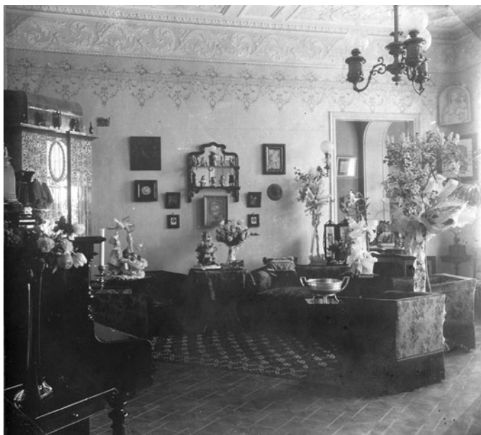
Іл. 3. Вітальня в будинку Грабарів. 1910-і рр.