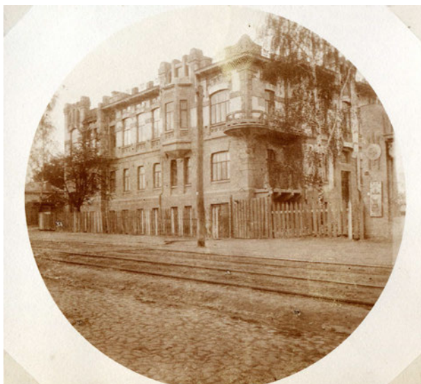
Іл. 1. Будинок М.С. Грабара на вул. Дорогожицькій. 1910-і рр.