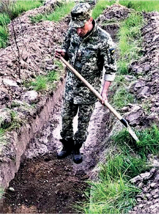
Рис. 3. Дослідження пізньотрипільського поселення в м. Києві.