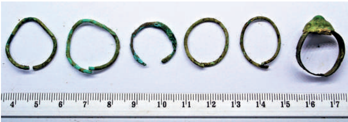
Рис. 5. Бишів. Інвентар середньовічного поховального комплексу.