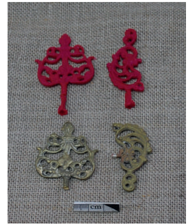
Рис. 10. Воскові моделі втрачених навершів хреста. Новоробні навершя.