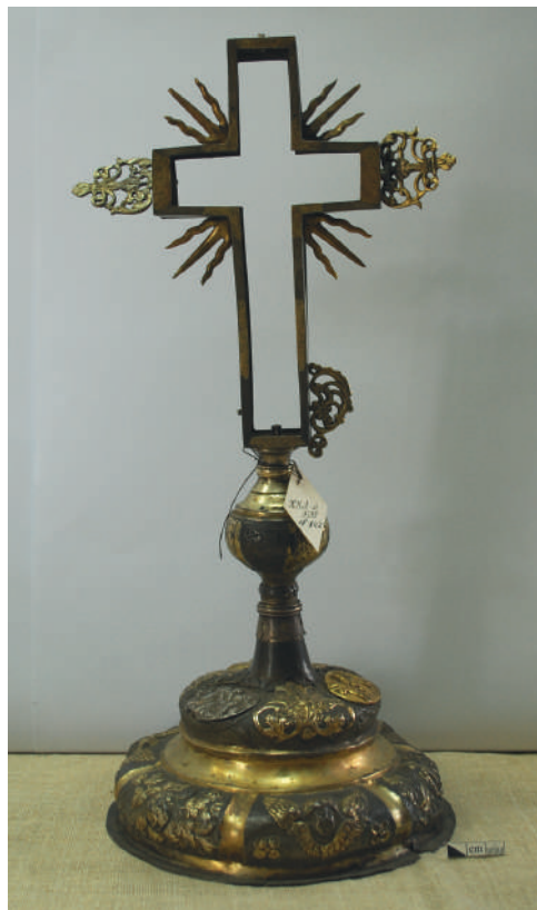
Рис. 6. Загальний вигляд оправи хреста, стоян та піддон до реставрації. Зворотна сторона.