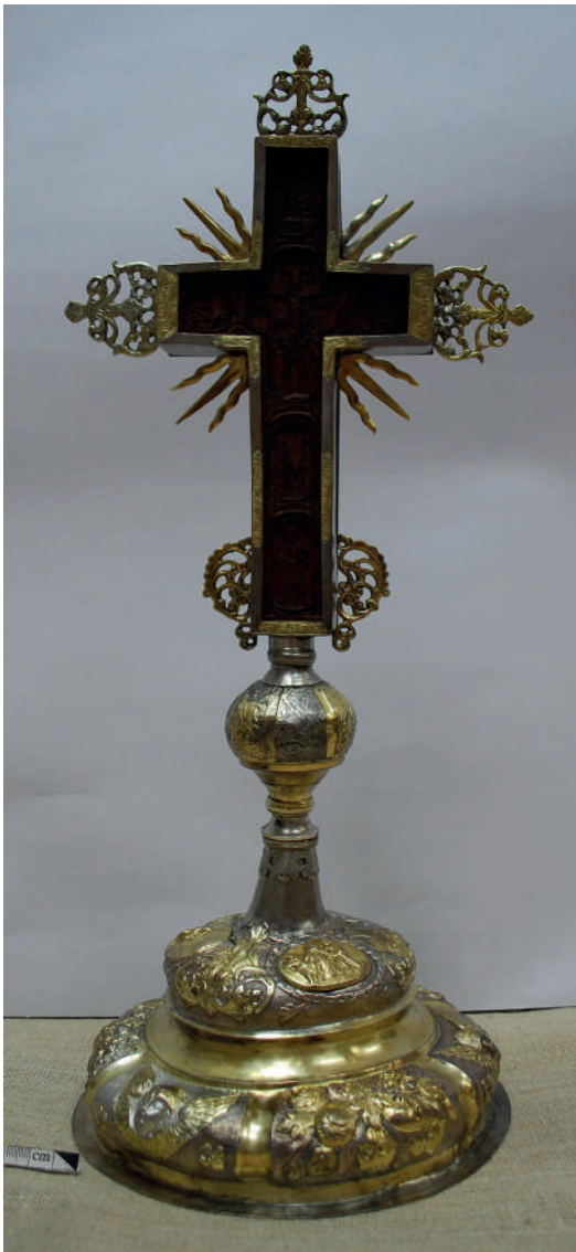
Рис. 11. Загальний вигляд хреста після реставрації. Лицева сторона.