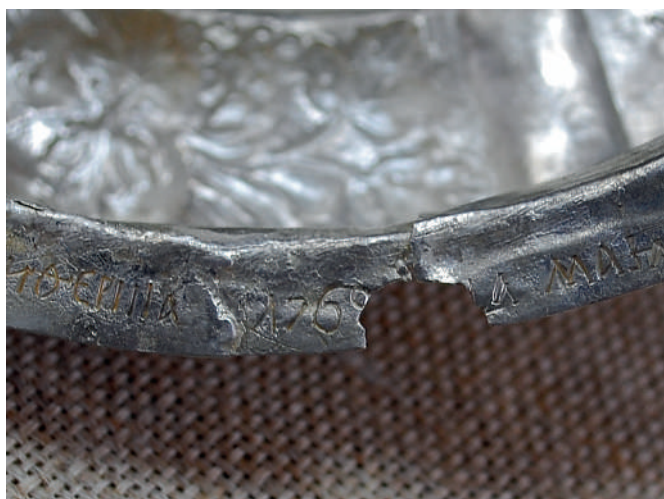
Рис. 7. Піддон оправи хреста: розрив та втрата на канті піддона. До реставрації.