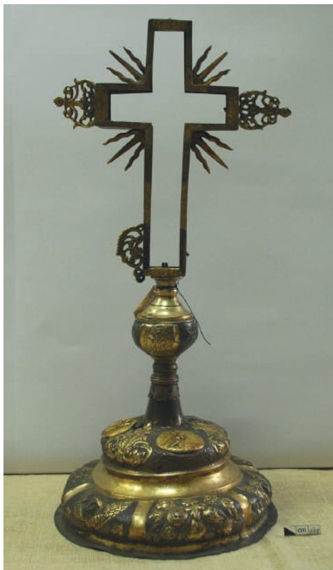
Рис. 5. Загальний вигляд оправи хреста, стоян та піддон до реставрації. Лицева сторона.