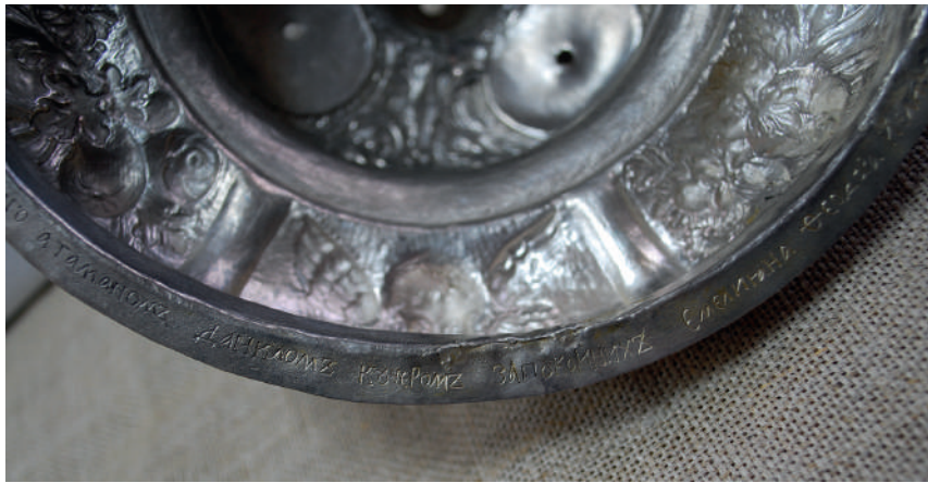
Рис. 9. Фрагмент піддону з вкладним написом в процесі реставрації.