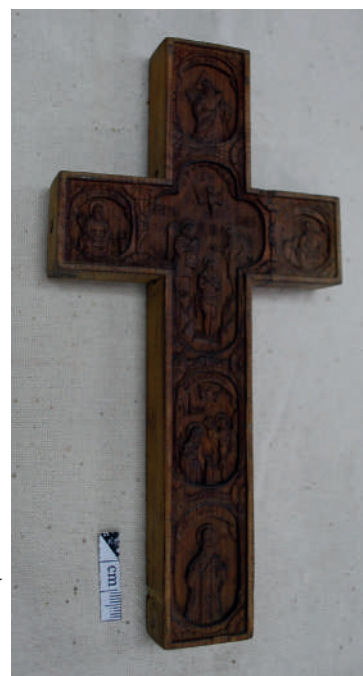
Рис. 4. Дерев'яний хрест. Зворотна сторона.