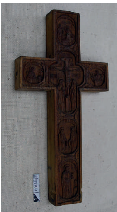
Рис. 3. Дерев'яний хрест. Лицева сторона.