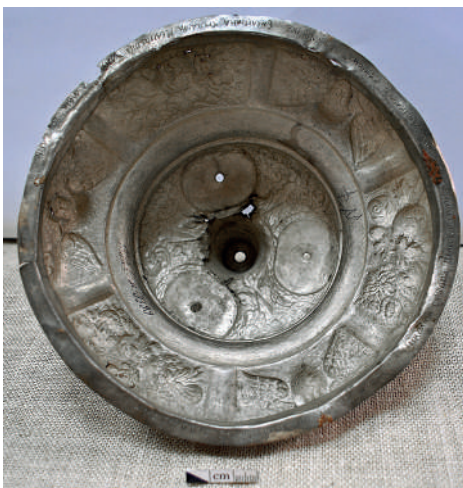
Рис. 1. Піддон хреста з вкладним написом до реставрації.