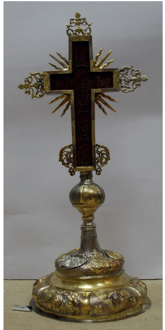
Рис. 12. Загальний вигляд хреста після реставрації. Зворотна сторона.