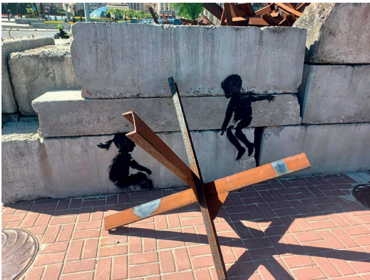
Мурал Банкси, створений художником на Майдані Незалежності в Києві.