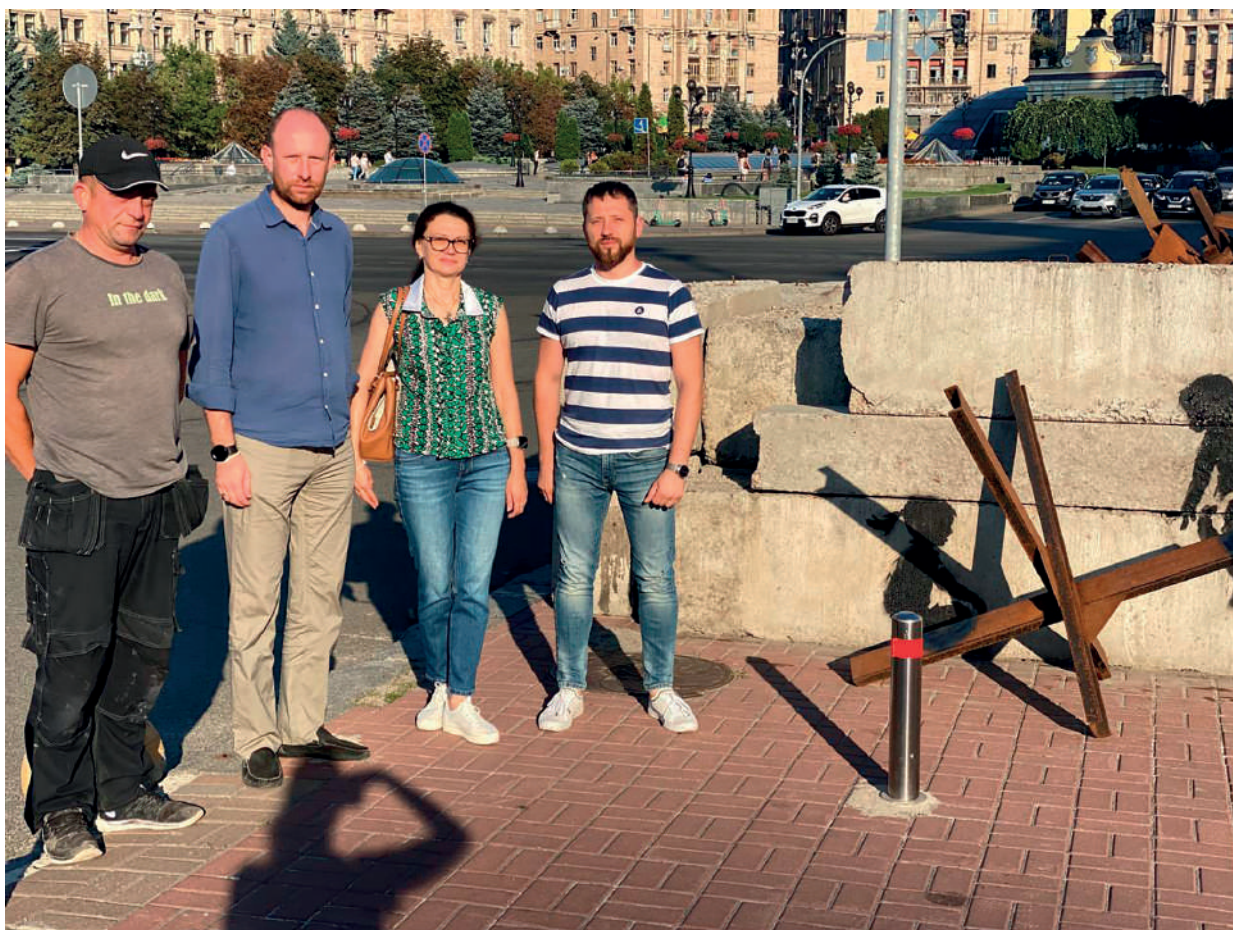
Команда фахівців на Майдані Незалежності в Києві.