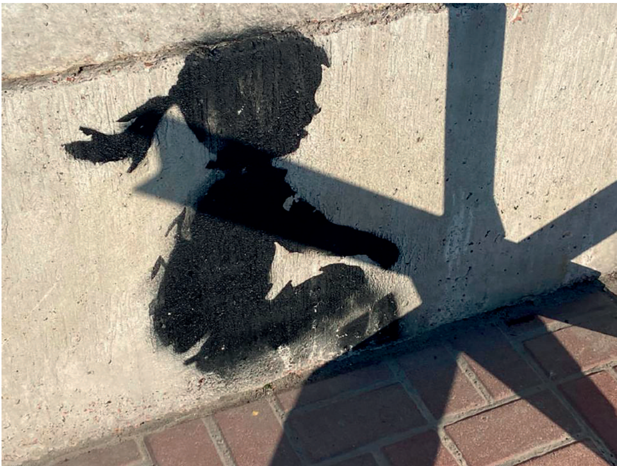
Фрагмент муралу Banksy, створеного художником на Майдані Незалежності в Києві.