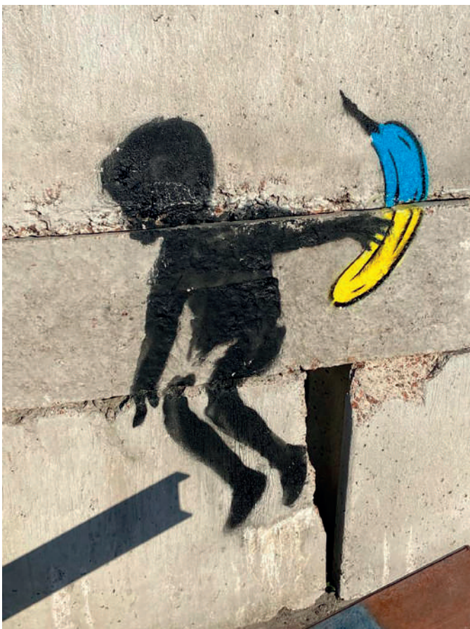
Фрагмент муралу Banksy, створеного художником на Майдані Незалежності в Києві, доповненого зображенням банана авторства Vanapensprayer.